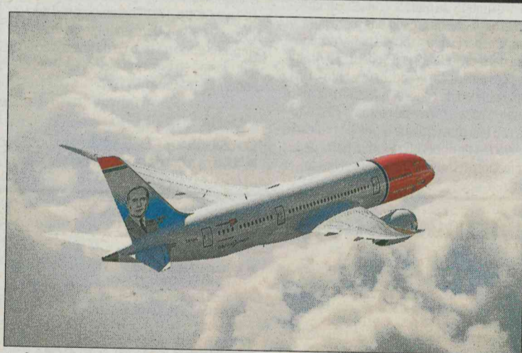
La imagen del pintor Joan Miró en la cola del Boeing 787-9.

y pedal de 30 notas, 45 registros y 2.625 tubos. Tal como añaden desde Santa Creu, tras la reforma el órgano ha adquirido "un gran valor en Mallorca para interpretar la música de órgano de J. S. Bach con la máxima fidelidad histórica debido a que la restauración ha sido hecha al estilo de los grandes órganos de la región alemana de Turingia, que inspiraron su música". El de la parroquia palmesana data del año 1760.