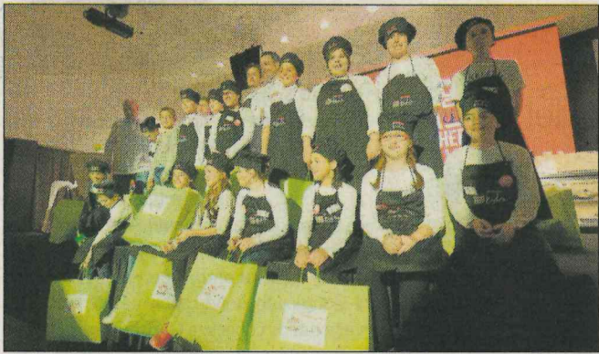
Participantes de Protur Kids en la pasada edición.

Comienza un largo fin de semana de alta gastronomía y concursos en el Protur Biomar Gran hotel&Spa*****