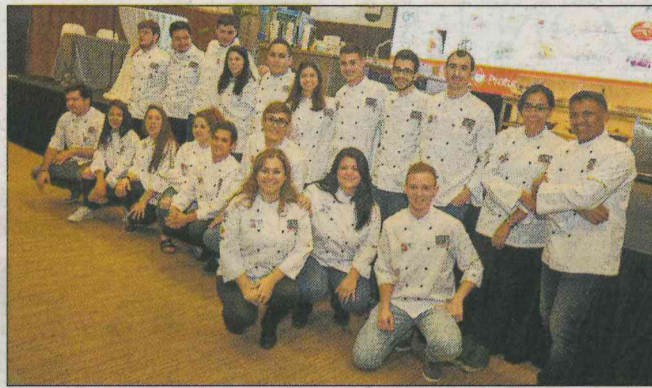
Los concursantes de la primera edición.

C on esta, la segunda edición, el Concurso Nacional de Escuelas de Cocina Protur Chef, se consolida como el concurso más importante a nivel nacional para estudiantes de escuelas de hostelería.