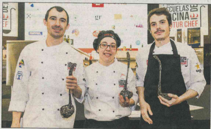
El ganador (d) y los finalistas de Protur Chef 2018. M. ADROVER

■ Tres días de intensas actividades, coloquios, conferencias, maridajes y talleres que han acompañado al II Concurso Nacional de Escuelas de Cocina Protur Chef. Durante las jornadas de viernes y sábado se desarrollaron las semifinales de la competición en la que dieciocho concursantes, provenientes de ocho Comunidades Autónomas, elaboraron un plato con una paletilla de cordero mallorquín