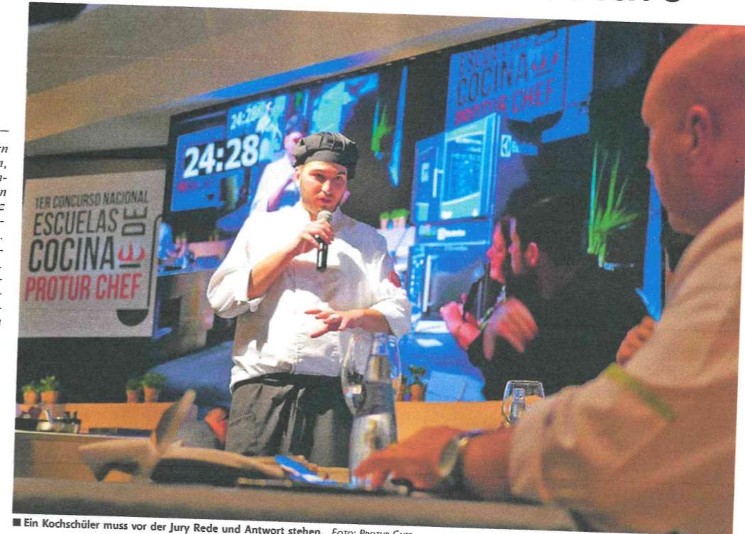
Ein Kochschüler muss vor der Jury Rede und Antwort stehen.

Von elf Kochschulen in ganz Spanien haben sich 18 Studenten qualifiziert. Es galt, zwei Rezepte mit entsprechenden Fotos einzureichen. Einmal sollte es ein Gericht mit Lamm sein, einmal ein nach freier Wahl, entsprechend unserem Wettbewerb, wo man zunächst mit dem Lammgericht überzeugen muss, um dann im Finale ein freies Gericht kochen zu dürfen – und damit dann vielleicht zu gewinnen. Insgesamt gab es etwa 50 Bewerber, davon hat das Komitee 18 ausgesucht. Unsere Bühne hat jeweils zwei Kochplätze, die Kochzeit ist reglementiert. Damit man noch mehr sieht, gibt es einen Kameramann, der den Köchen über die Schulter und in die Töpfe schaut. Seine Bilder werden parallel zusätzlich auf einer großen Leinwand gezeigt.