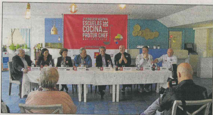
La presentación se celebró ayer en Taronja Negra Mar.