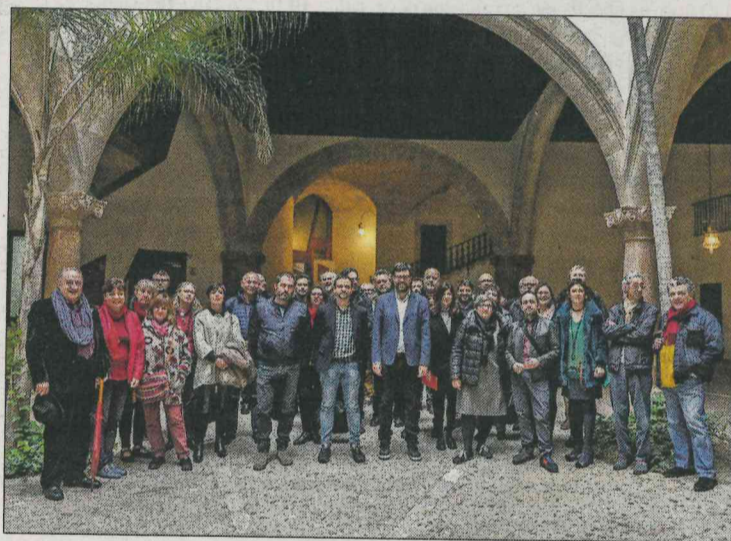
Los miembros del Consell de Cultura reunidos ayer en su estreno.

El Consell estará formado por 40 miembros, entre ellos 16 entidades y 16 profesionales, la mitad de los cuáles serán nombrados por la Regidoria de Cultura y la otra a propuesta de las entidades. Por primera vez se incorporan al equipo 5 técnicos de cultura, con voz pero sin voto, con el fin de